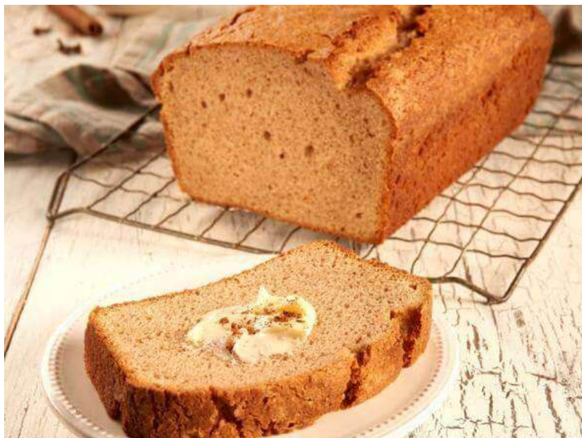
Immagine 2 - Pane speziato al miele e alla cannella.

Il pane speziato al miele e alla cannella è una sorta di pan pepato che si sposa perfettamente con il freddo dell'inverno e l'atmosfera calda delle festività natalizie. Inoltre, il suo aroma di miele e spezie è l'ideale complemento per terrine e patè, formaggi, pesce affumicato.