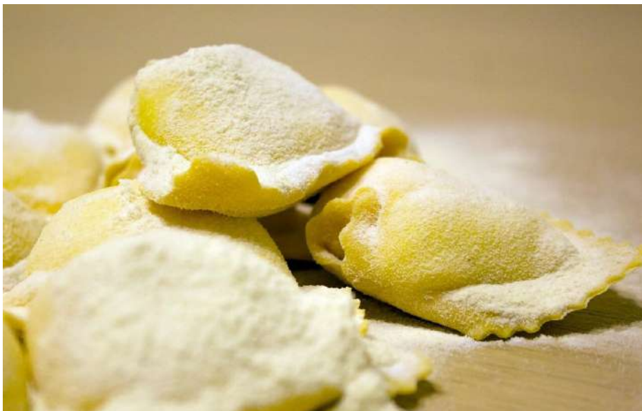
Immagine 1 - Ravioli ripieni di ricotta, Parmigiano Reggiano e miele.

I ravioli ripieni di ricotta, Parmigiano Reggiano e miele sono un primo piatto particolare e raffinato in cui risalta il contrasto tra dolce e salato.