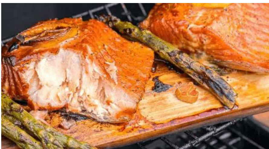
Immagine 3 - Salmone glassato con miele e arancia

Il salmone glassato con miele e arancia è un secondo piatto perfetto per chi ama il gusto agrodolce; la sua marinatura e glassatura realizzata con miele, arance e marmellata di arance lo rende adatto per una cena o un pranzo di Natale elegante e raffinato.